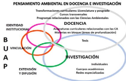
Figura 2. Modelo del PA en la enseñanza e investigación en la BUAP.

El modelo que representa el pensamiento ambiental en la enseñanza e investigación en la BUAP es como se muestra en la Figura 2.